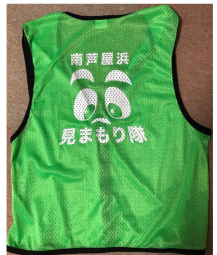
↑羽織って散歩や買い物するだけで効果あり！防犯パトロールや、通学路立ち当番などに使用