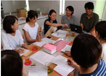
みんなで楽しく準備中！

近年目を疑うような事件が頻発している、それは涼風町にとっても決して他人事ではない。実際に不審な人物も確認されている。近隣関係の希薄さが招くリスクは既に多くの現場で議論が交わされている。ただし涼風町は子育て世代が多く、気さくな方々が多い。異変に気付けば近所の方は直接また、上級生の子供が親へ連絡、すぐにLINEで連携がとれる。そう、イベントを通じて親も子供もネットワークが広がっているのだ。あれ？あの子一人で帰って？少しの変化で気づく事ができる。さらに涼風町には防犯委員会もあり、見回りや朝早く