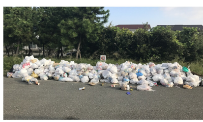
▲残念ながら涼風町釣り場の現状です（清掃後ではなくポイ捨てです） カラスや臭い、もはや海辺周辺の問題だけではありません！

掃除をするに助成金？ 人と自然を調和させる活動が 地域の絆を生み出す エサ、釣り具を販売するフィッシングマックスにも協力を要請、現状を伝える。 フィッシングマックスも協力体制へ