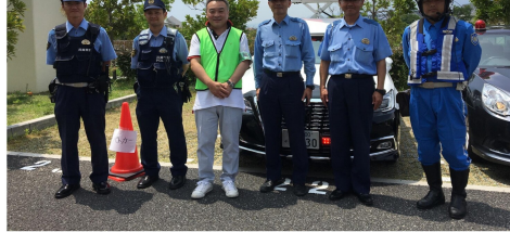
防犯活動の一環として、防犯委員長は毎朝小学生登校時潮芦屋中央の押しボタン付近で、見守りを実施されている。課題として下校時の見守りができない事、下校時刻にもバラつきがあり、参加者を呼びかけている。

近年未曾有の大災害や、物騒な事件が起きています。芦屋市内、特に涼風町は現状は無縁な状態ですが、それでも不審情報もあれば、海に面した街で備えはやはり必要です。しかし対策をするには人手が必要