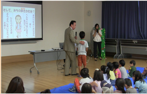
↑新光警備保障担当者による防犯教室です、たくさんの子どもが参加♪