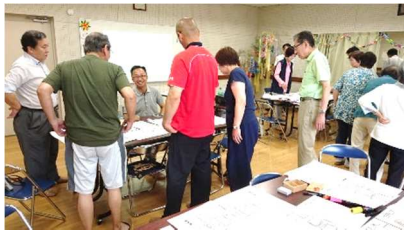
避難所運営ゲーム 小学生も参加。