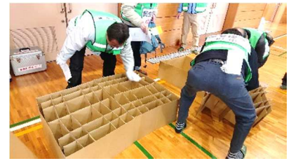
段ボール簡易ベッド組み立て