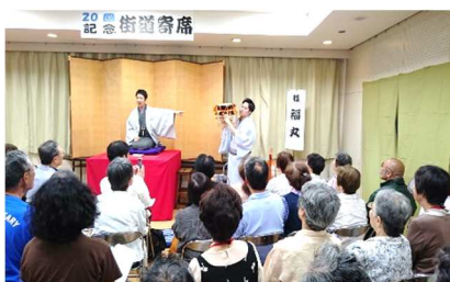
街道寄席(茶屋集会所)