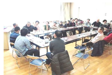
落語家を交えてティータイム