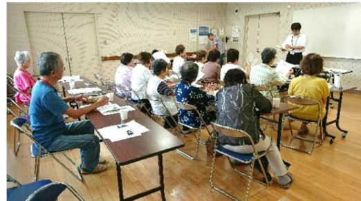
芦屋市の歴史講座