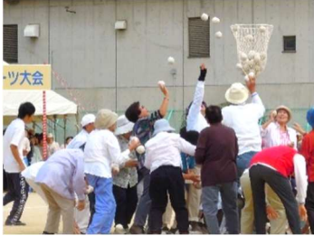
秋のスポーツ大会