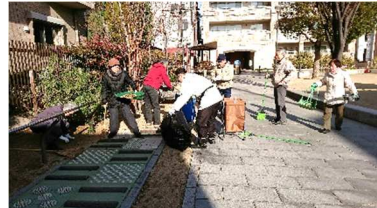
公園清掃(毎月第2日曜) 10人前後の方々毎回参加