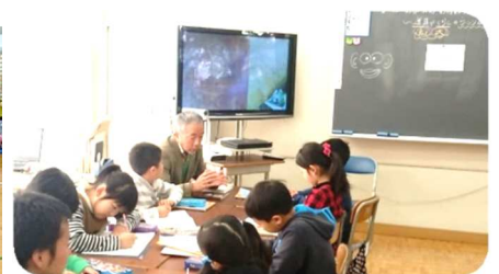
精小で昔の生活を話し、 鉛筆削りを指導