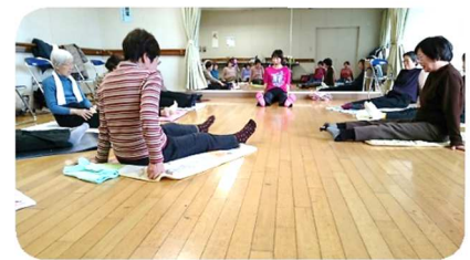
大人気の健康体操