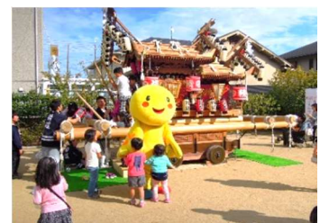
はばタンも毎回登場

イベントに参加して盛り上げていただいた町外の方々、各種協賛をいただいた町内の事業者の皆さんにも、大変お世話になりました。