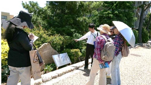
芦屋の史跡ウォッチング