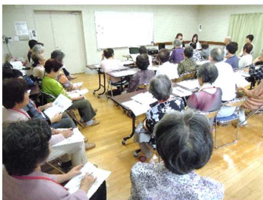
芦屋市職員による認知症 サポーター養成講座