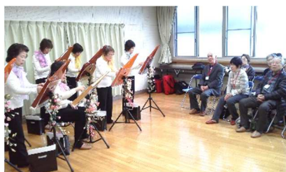
ヘルマンハーブ演奏