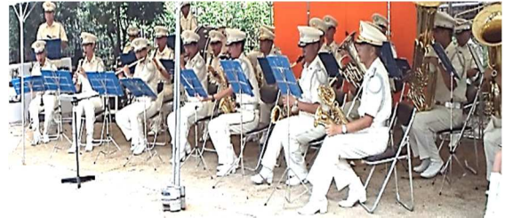
兵庫県警察音楽隊