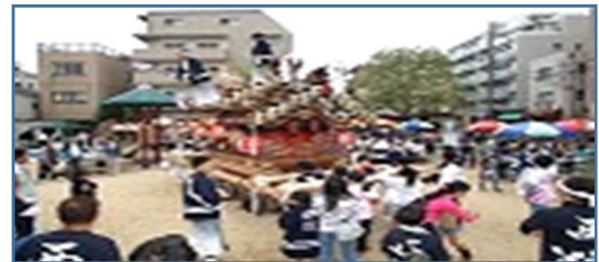
精道地車(だんじり)が初参加の時