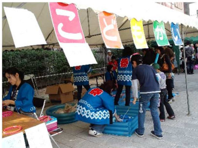
子ども会のゲームコーナー