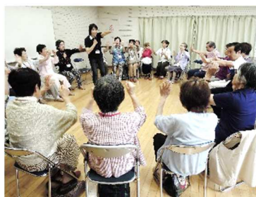
認知症予防ゲーム