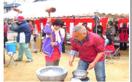
同じ場所で餅つきも