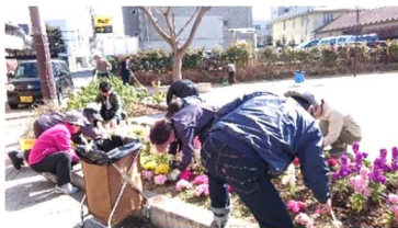
公園花壇整備(年3回 の植替え、日々の水遣り)