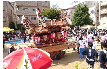
今では、だんじりは 茶屋秋まつりの定番に