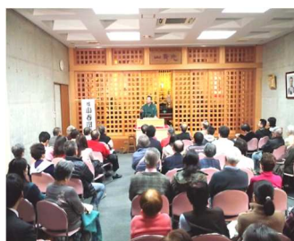
寺子屋寄席(西法寺)