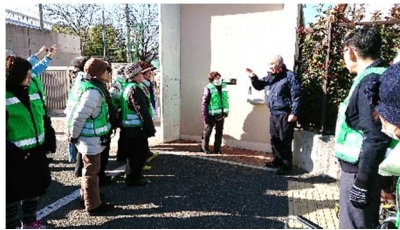
精道小学校正門前の防災 鍵ボックスの説明を受ける