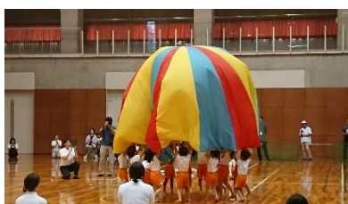
青少年センター 7月