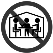
換気の悪い 密閉空間

御自身、御家族、御近所さんともども、三密<ぎゅうぎゅう・むんむん・がやがや>を避け、免疫力をアップさせてお体を大切になさってください。