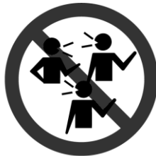
間近で会話する 密接場面