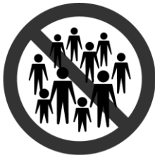
大勢がいる 密集場所