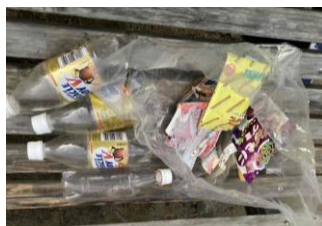
<1日で集められたゴミ>

毎朝、有志の方々が公園をお掃除してくださっています。たばこの吸い殻、お菓子の空き袋、ペットボトル、空き缶等毎日大量のゴミが放置されています。一人一人の心がけで、快適に過ごせる公園にしたいですね。