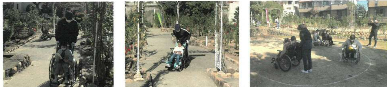
車いす体験訓練。バラ園の坂道体験や土の上での体験は貴重な体験でした。警察学校学生が熱く指導を。

者生活支援センターの方に指導を受けての活動でしたが、いい経験が出来たと喜んでいました。次回があればぜひ参加したいとの感想も。