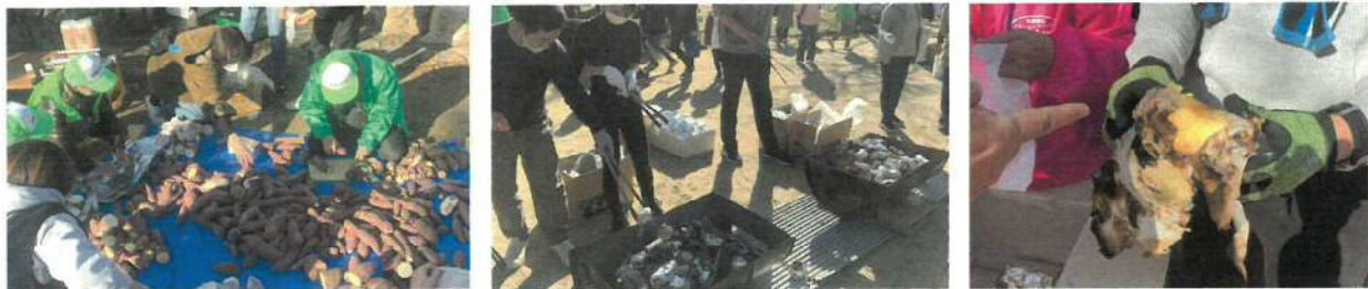
焼き芋の準備。芋を洗ってキッチンペーパーとアルミホイルに包み、コンロに。コンロの火おこしも大変!

◆車いす体験には警察学校の学生がボランティア参加し終始熱心にサポートしてくれました。彼らも車いすは初体験。開会前に東山手高齢