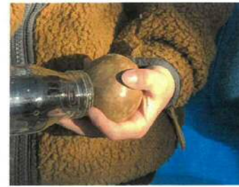
どんぐり銀行。園内で集めたどんぐりで通帳を作成