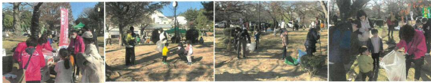
受付後に清掃活動を。みんなでワイワイと楽しみながら汗をかくほど走り回りました

祉アクションプログラム)をはじめ東山高齢者支援センター、警察学校、芦屋警察署の協力(特殊詐欺防止広報活動と白バイ・パトカーの参加)、芦屋大学、市役所地域福祉課、あしや楽舎の会など多くの賛助を頂き、町内の公園での素晴らしい賑わいづくりとなりました。わずか半日でしたがこんなに楽しい集いになったこと、関係者の皆さまに感謝しています。