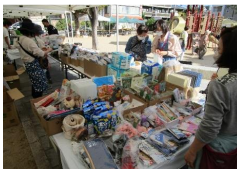
左 茶屋公園で (自治会主催)