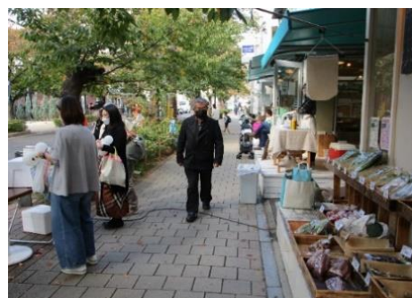
右 茶屋さくら通り の歩道で (茶屋さくら通り 事業者会主催)