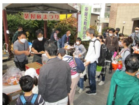
右 精道ダンジリ 今年も参加 します