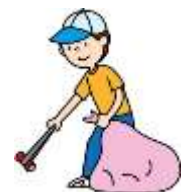
9月7日 仲池公園清掃には30人近くの皆さんが参加していただきました