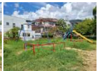
◇8月25日の第2児童公園(左2枚)と北公園(右2枚) このあと市が除草に入ってくれ綺麗になったが…