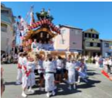
午前の本通り。市内6台のだんじりのパレードは勇壮で熱気ムンムン