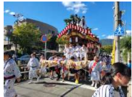
午後2時半、筋師医院前を出発。

「あしや秋まつり」が快晴の空の下で開催されました。会場の本通りは距離的に岩園町から遠く縁遠い祭りかもしれませんが、皆さんは参加されたことありますか？