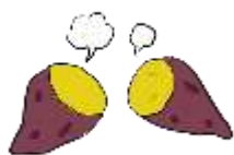
公園清掃と焼き芋会