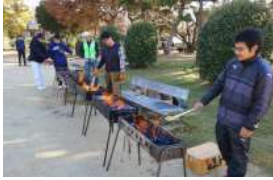
500個の焼き芋、焼くぞ!…ひかる泥団子遊びは大人気、ワイワイ