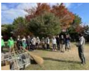
11月の清掃には20名余の参加。ベンチ前のたばこの吸い殻(#`д´)