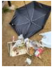
甲南公園の受託清掃。毎月こんなにゴミを収集