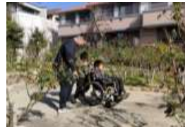
車いす体験には高校生のサポートも。電動は市長も体験