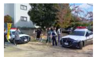
警察署は詐欺被害防止の広報