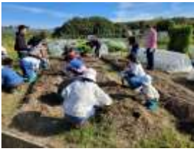
11月9日にサツマイモ収穫祭、大不作