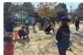
芦屋大学生のミニソーラーカー体験やどんぐり銀行 自主防災会は消火器体験や手作り担架体験